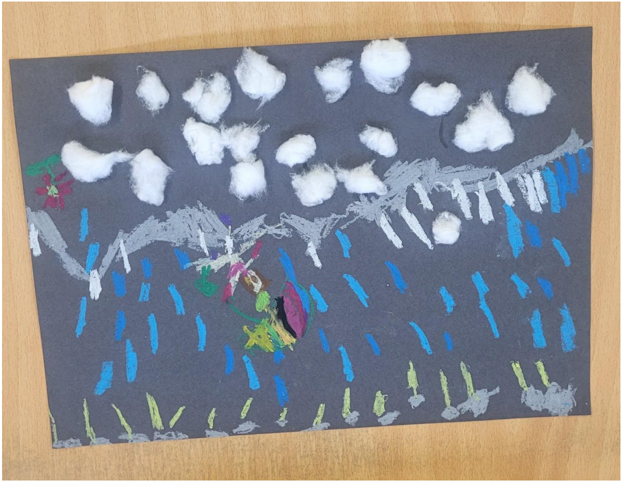
Χειμώνας ,κρύο παγωνιά!